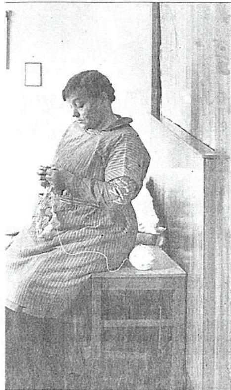
1, sogenannten Versorgungsheims der Sozial- mit Handarbeit.

Bis 2017 vestiert; allein 50 Millionen für Riehl, wo der erste von sechs Neubauten laut Ludorff im Februar eröffnet werden soll. Der